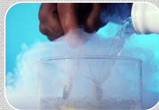
Химическая (синтетический азот, электрохимическая)