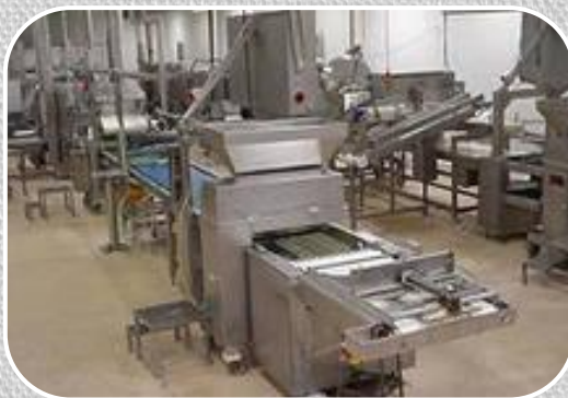
Машиностроение (станкостроение, приборостроение и др.)