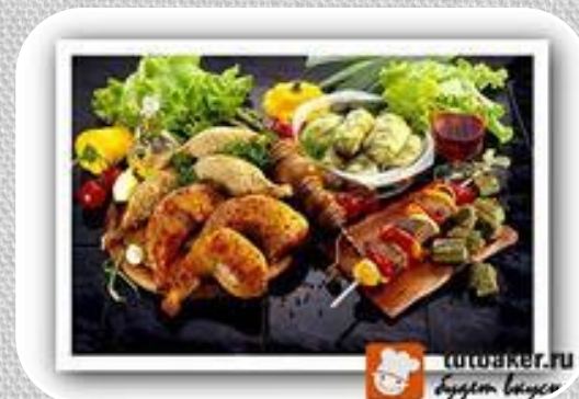
Пищевая (мясная, консервная, табачная)