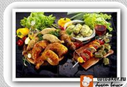
Пищевая (мясная, консервная, табачная)