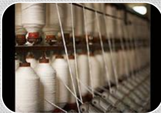
Легкая (текстильная, ковровая, кожевенная)