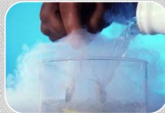
Химическая (синтетический азот, электрохимическая)