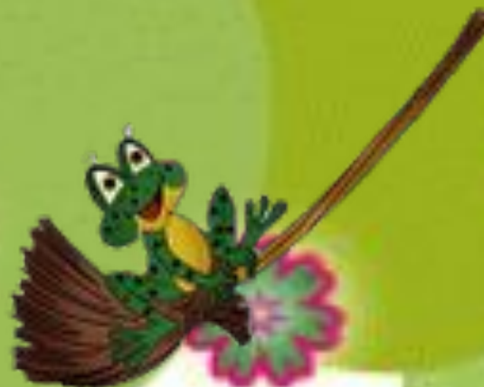
Лягушка на метле