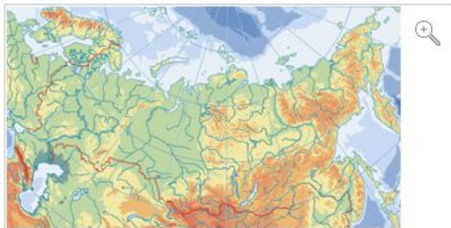
Крупнейшие реки России

Территорию России покрывает относительно густая сеть крупных и малых рек. Общее число рек превышает 2 млн. Их суммарная длина более 6,5 млн. км.