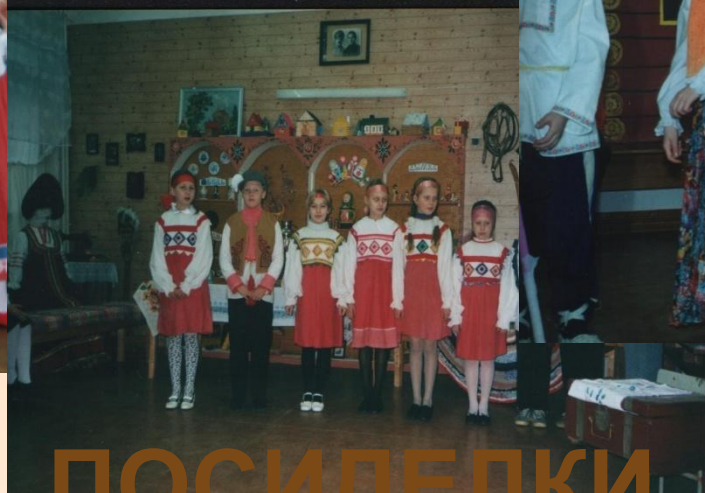
ПОСИДЕЛКИ В ИЗБЕ