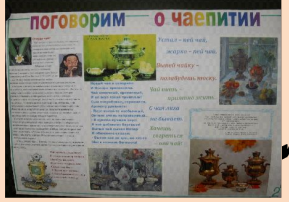
коллективные и индивидуальные проекты