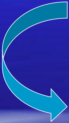
Места для зрителей