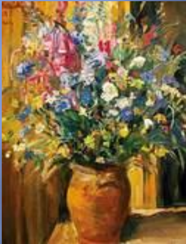
Н. Миллиоти. Полевые цветы

На лугу растёт ромашка, Лютик едкий, клевер, кашка! Что ещё? Кошачьи лапки, Одуванчиковы тапки, Подорожник, васильки, Граммфончики – вьюнки, Ещё много разных травок У тропинок, у канавок, И красивых, и пушистых, Разноцветных и душистых!