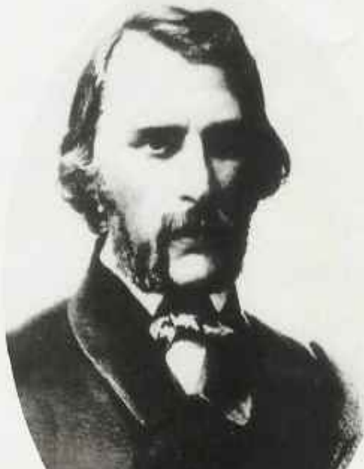
Чинovníк особых поручений Министерства внутренних дел и начинающий поэт Иван Тургенев. 1840-е годы.