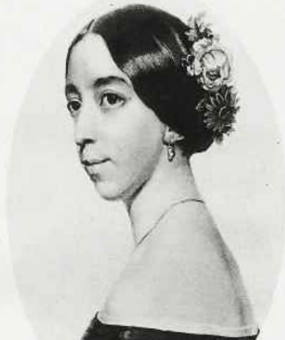
Полина Виардо в конце 1830-х. Фотография сделана вскоре после дебюта артистки на сцене в Брюсселе.