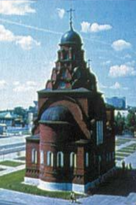
Старообрядческая Троицкая церковь Расположена в центре Владимира