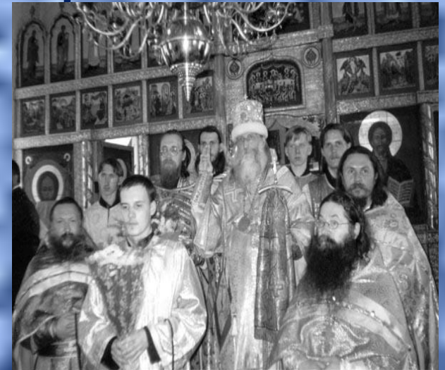
Во многих населенных пунктах Владимирского края проводятся богослужения в старообрядческих храмах.