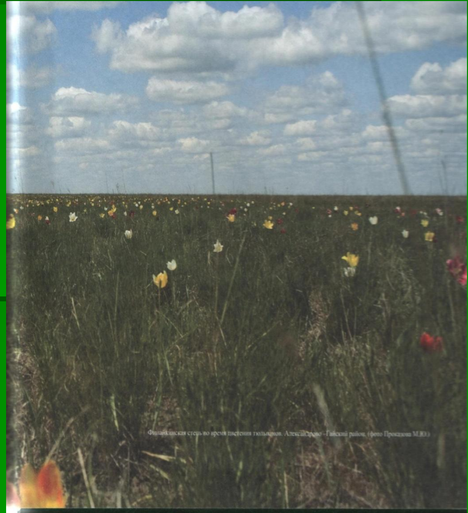
Финляндская степь во время цветения тюльпанов. Алексийское – Гавский район.