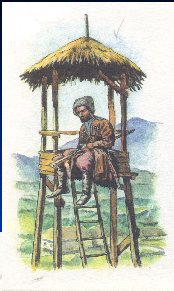
Урядники Ставропольского и Хоперского полков. 1835 — 1838 годы

При Петре I стали создаваться укрепленные линии на Кавказе, которые представляли собой длинные цепочки казачьих станиц. Делалось это для защиты близких русским по вере грузин и армян. Основная тяжесть повседневной службы по охране границы легла на плечи казаков.