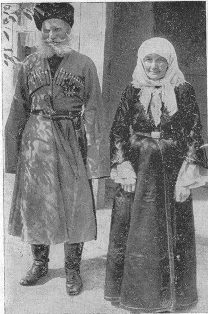
Старинный костюм терских казаков (ТЭЭ МГУ, 60-е годы XX в.)

Головные уборы у казаков играли огромную роль в обычаях и символике.