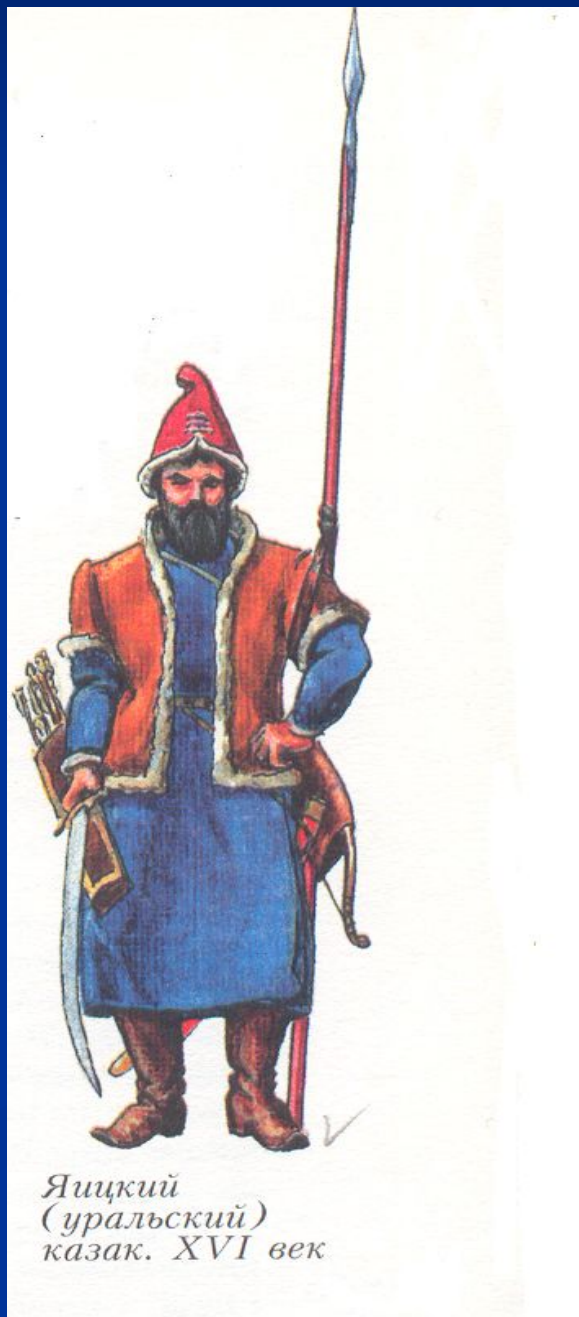
Яицкий (уральский) казак. XVI век