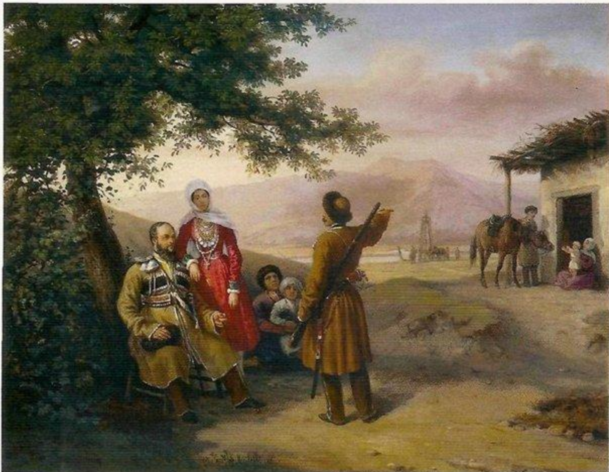
Портрет семьи Арнаутовых. 1840-е. Самарский областной художественный музей

Многие нравы и традиции казаков выражались через действия с головным убором