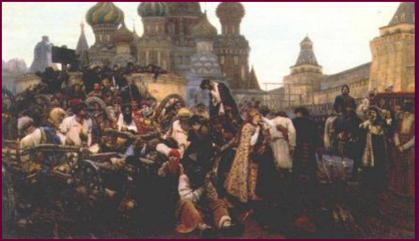
В.Суриков, Казнь в Москве, казни.