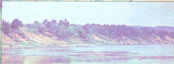
Коренной берег реки Вятки