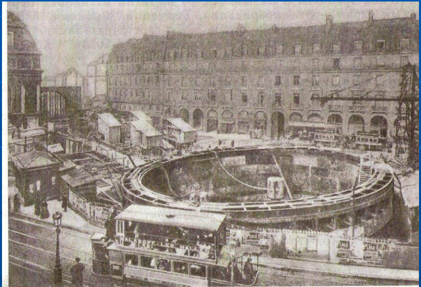
Франция. Париж. Строительство метро. 1906 г.