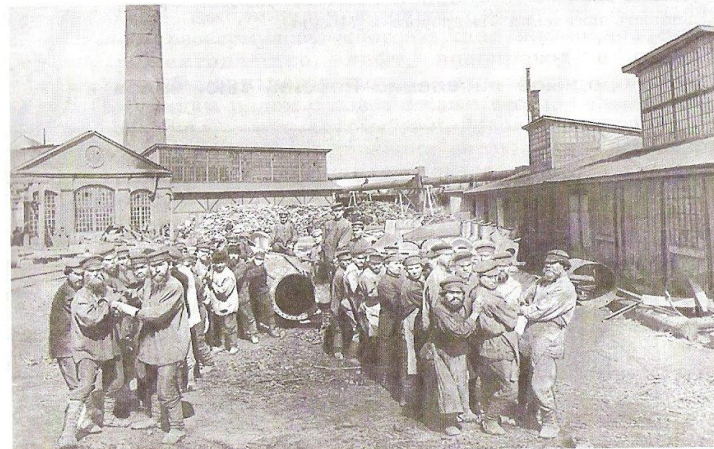
Рабочие начала XX в.