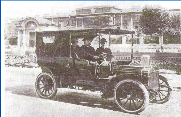
Легковой автомобиль на улице Фонтанка в Петербурге. Фото 1910 г.