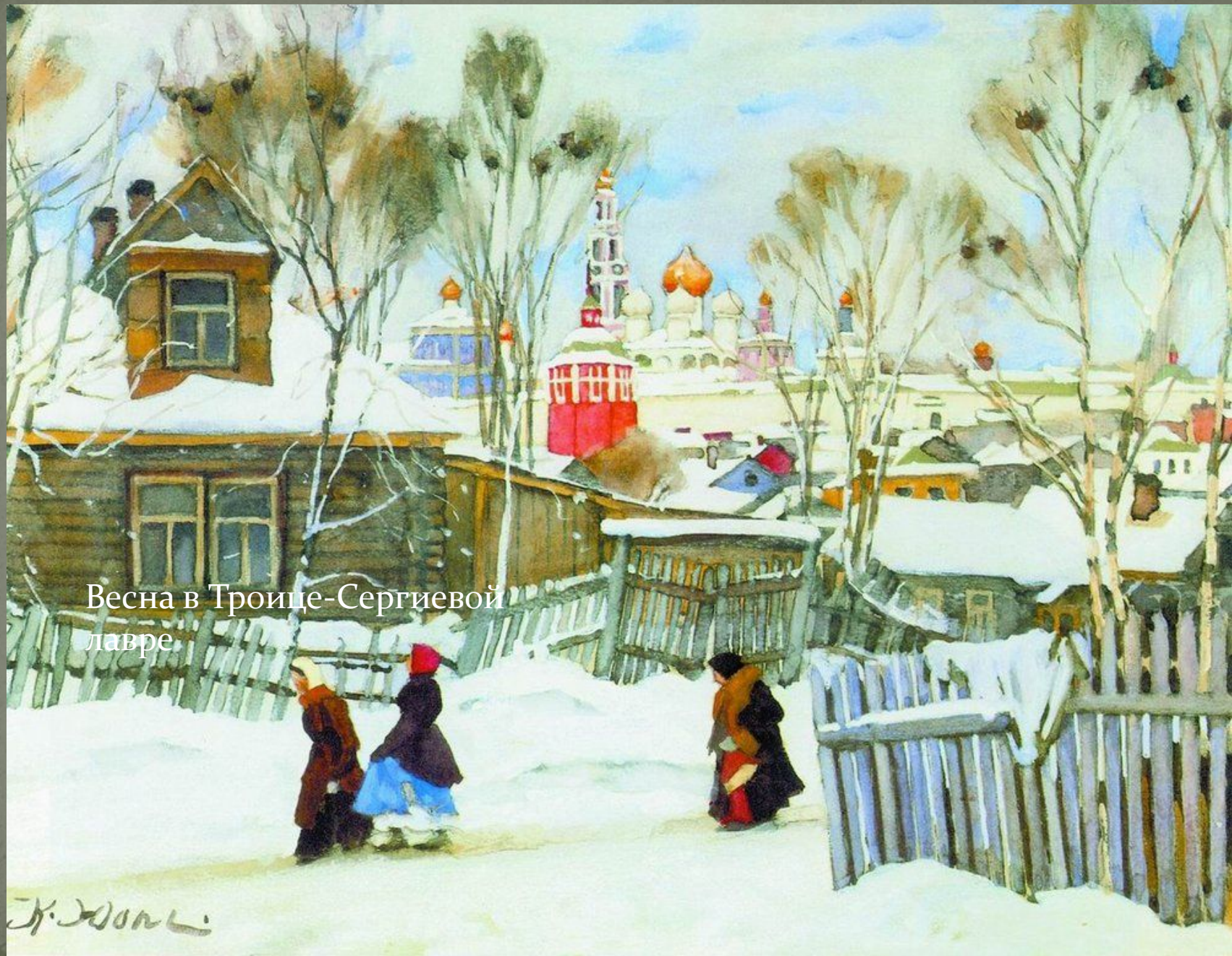
Весна в Троице-Сергиевой лавре