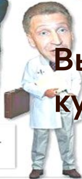
Игорь Сечин , вице-премьер, - переводчик в Мозамбике (французский язык)