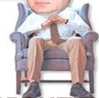
Александр Жуков , вице-премьер, - экономист ВНИИЭМН, член Президиума Академии наук СССР