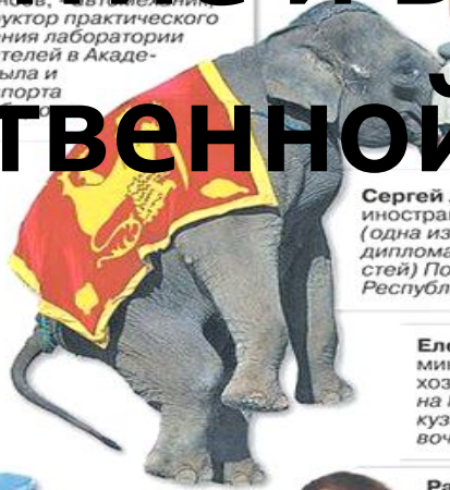
Сергей Лавров , министр иностранных дел, - атташе (одна из «простеньких» дипломатических должностей) Посольства СССР в Республике Шри-Ланка