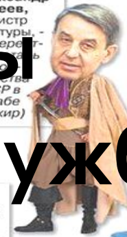
Александр Авдеев , министр культуры, - режиссер спектакля «Анна» в Аннабе (Алжир)