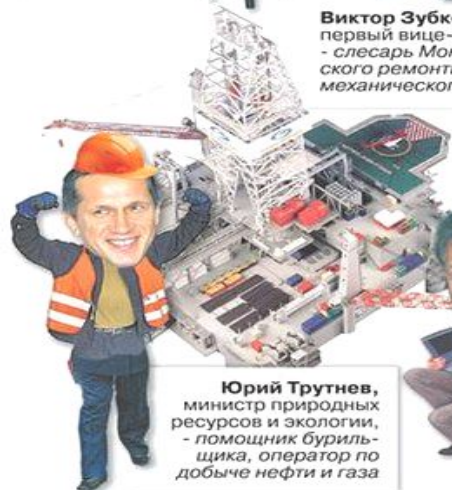
Юрий Трутнев , министр природных ресурсов и экологии, - помощник бурильщика, оператор по добыче нефти и газа