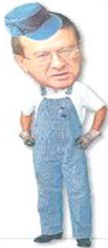
Виктор Зубков , первый вице-премьер, - слесарь Мончегорского ремонтно-механического завода