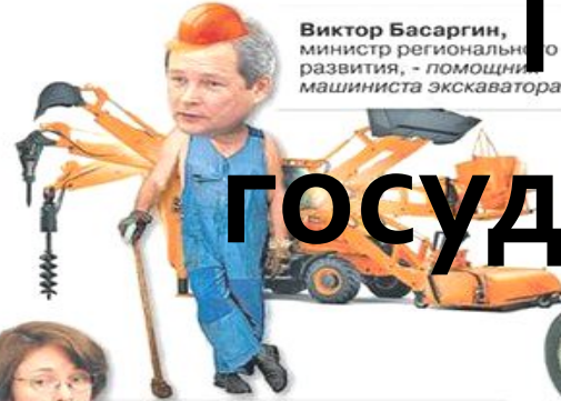
Виктор Басаргин , министр регионального развития, - помощник машиниста экскаватора