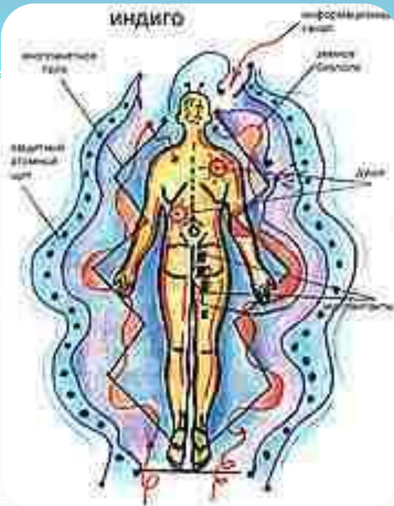
Иллюстрация одного из представлений об ауре.

Разумеется, человек — биологическое существо. И это нельзя игнорировать. Однако современный научный анализ показывает, что лишь примерно 15 процентов всех актов человеческой деятельности носит чисто биологический характер. Человек не может существовать вне общества. Специфический общественный образ жизни способствует постоянному усилению роли внебиологических, социальных закономерностей в жизни человека и общества.