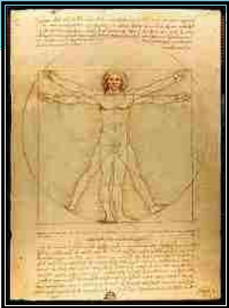
Витрувианский человек Леонардо да Винчи