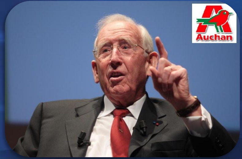
Gérard Mulliez, le président fondateur d'Auchan