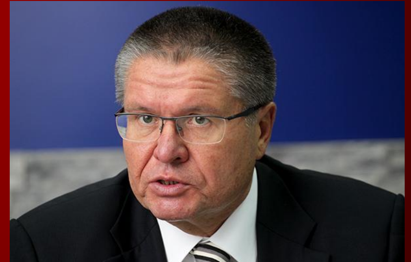
Министр экономического развития РФ Алексей Улюкаев

Увеличение товарооборота должно быть заметно в секторе авиационной, железнодорожной техники, энергетического оборудования