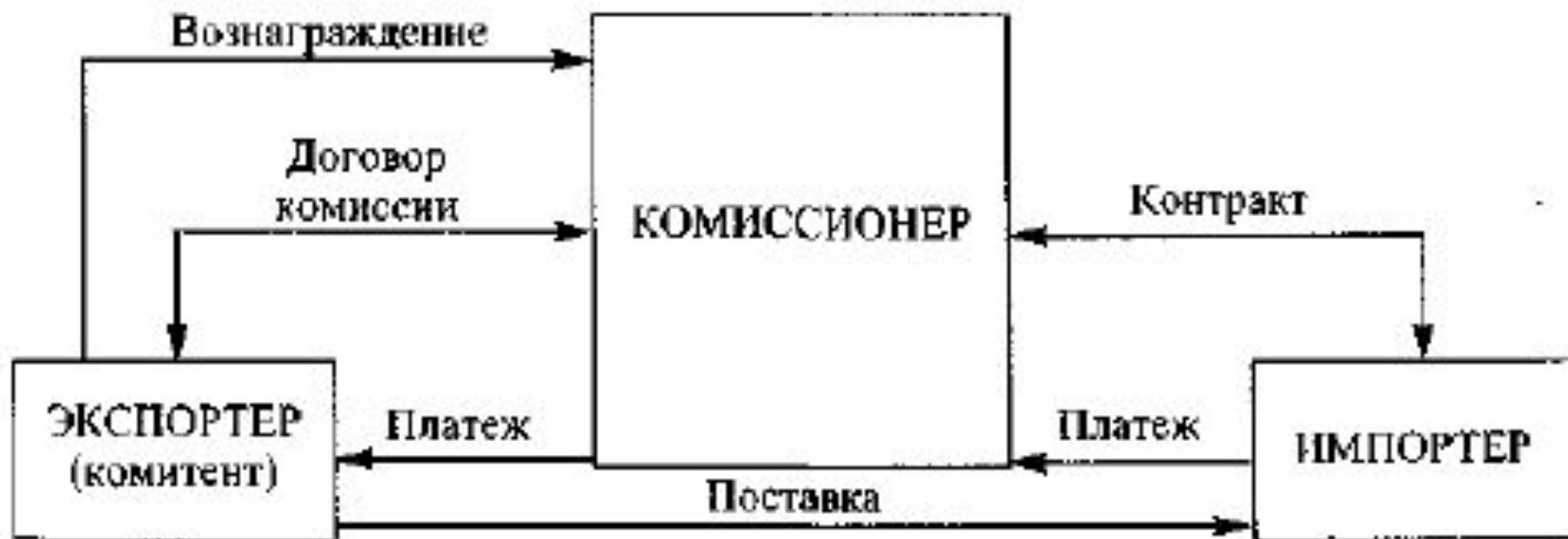
Рис. 28.3. Схема действий комиссионера