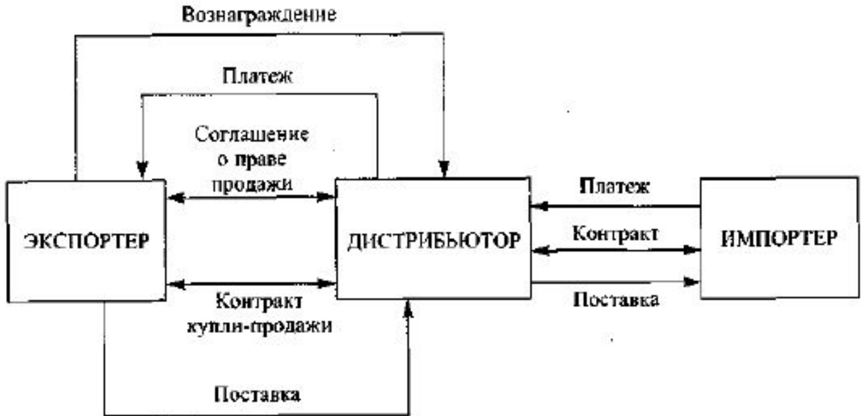
Рис. 28.6. Схема действий дистрибьютора