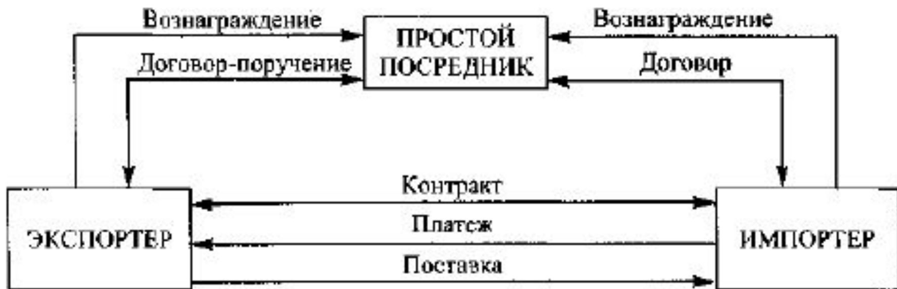
Рис. 28.1. Схема действий простого посредника