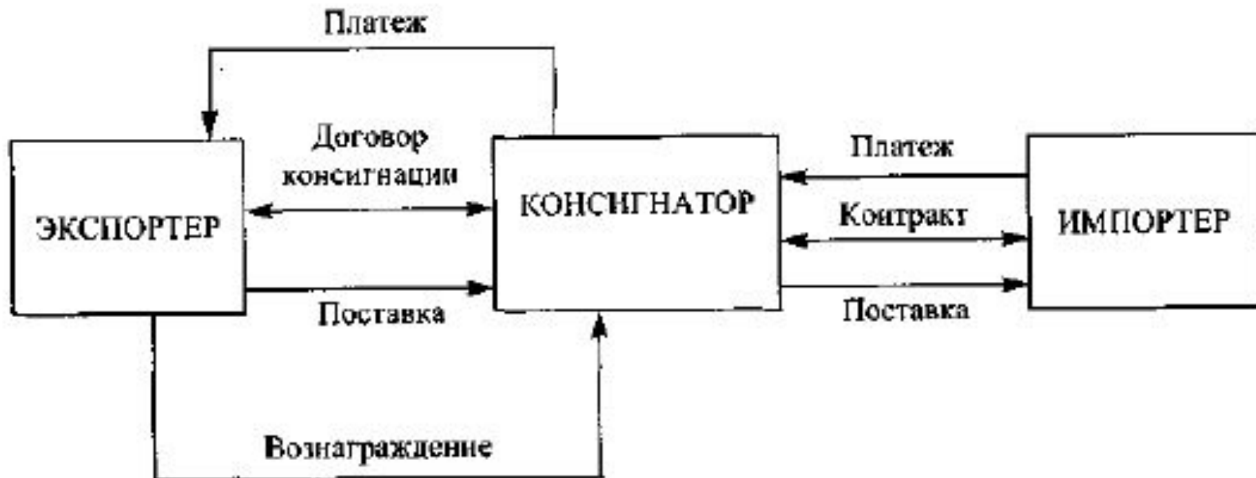
Рис. 28.5. Схема действий консигнатора