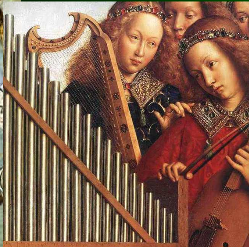
Я. Ван Эйк. Фрагменты картин