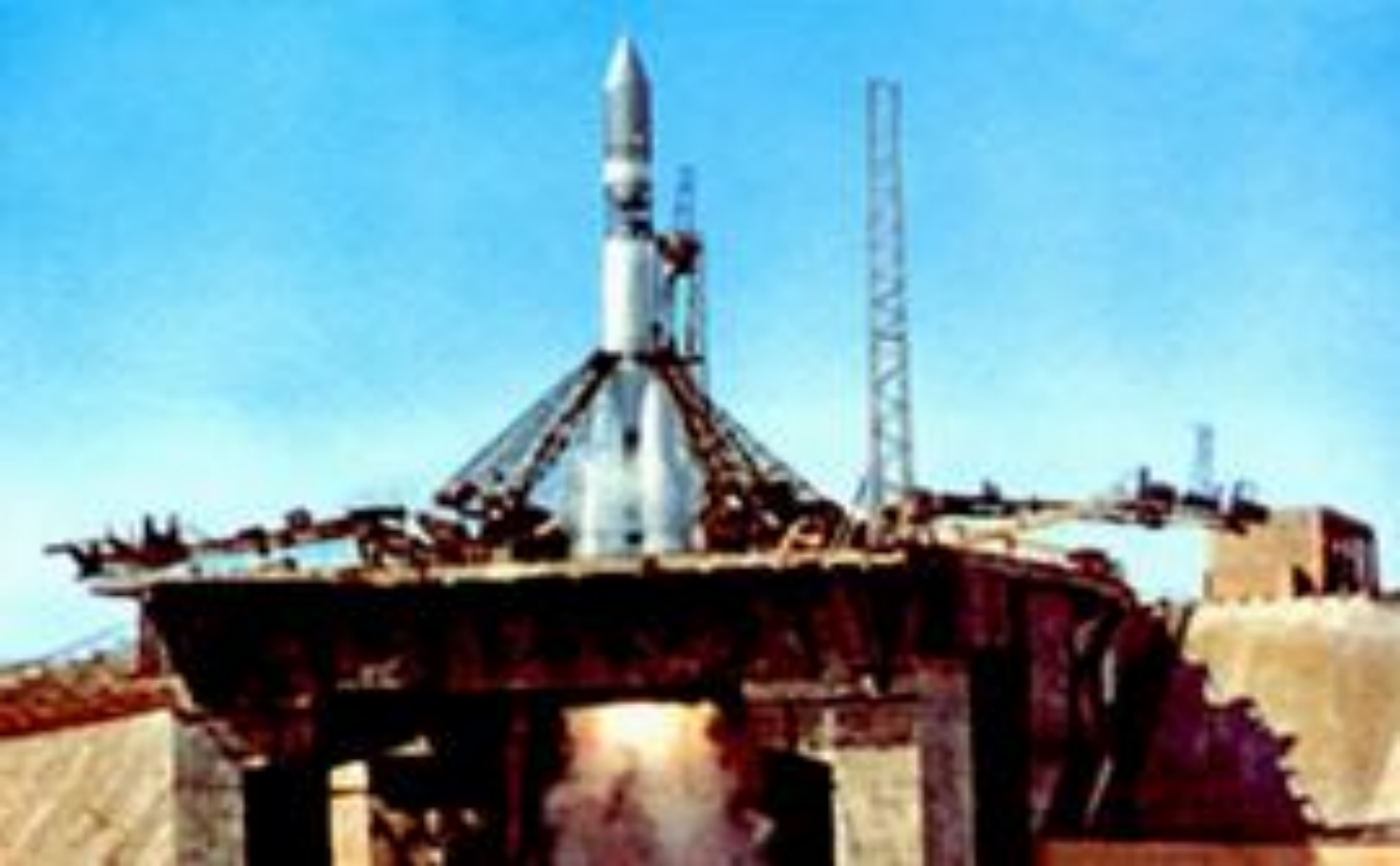
Первый космический корабль «Восток»