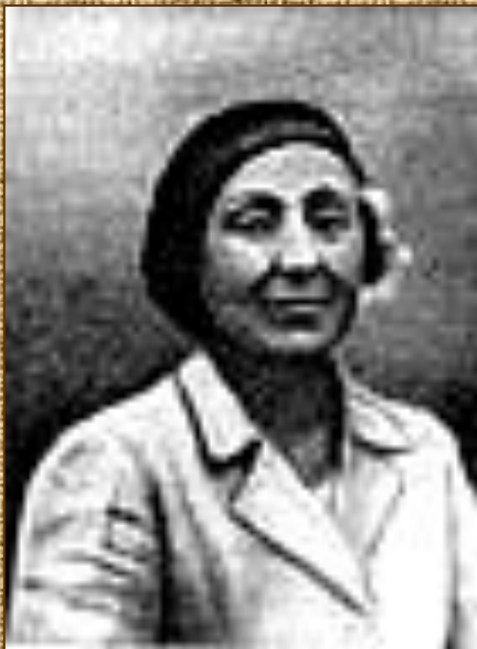
Елабуга, 1941 г.