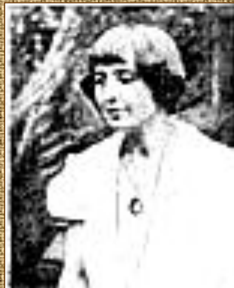
Прага, 1939 г.