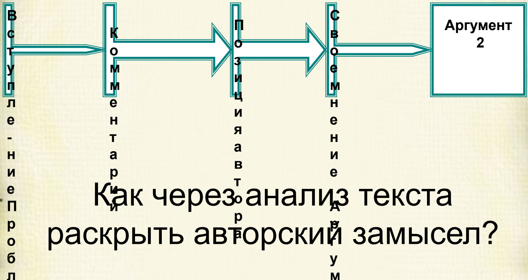
Схема сочинения-рассуждения (часть С)