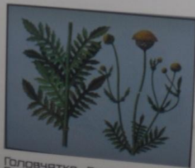
Голозачка Литвинова Cerphalaria litvinovi СЕМЕЙСТВО ВОРСЯНКОВЫЕ