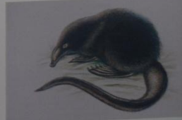
Выхоль Desmana moschata Linnaeus