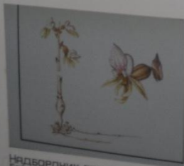
Надборзник безлиственный Epipodium arhalioides СЕМЕЙСТВО ЯТРЫШНИКОВЫЕ