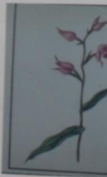
Пальчеголовник Cephalanthera rupestris СЕМЕЙСТВО ЯТРЫШНИКОВЫЕ