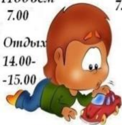
Отдых 14.00- -15.00