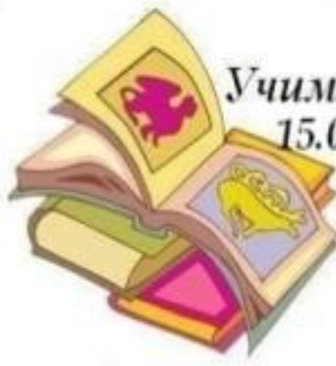
Учим уроки 15.00-17.00