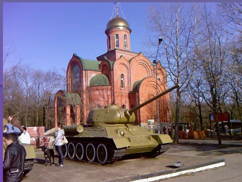
Мемориал героической обороны Одессы 411-й береговой батареи