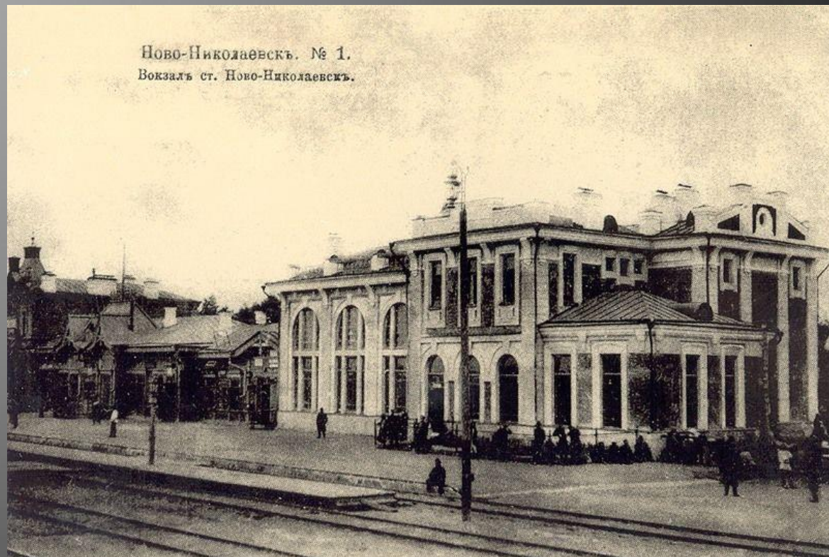
Ново-Николаевскъ. № 1. Вокзалъ ст. Ново-Николаевскъ.