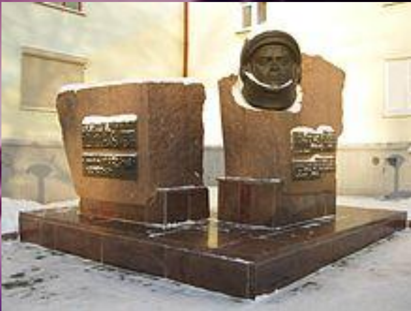
Памятник А.Г.Николаеву на пересечении с проспектом Ленина