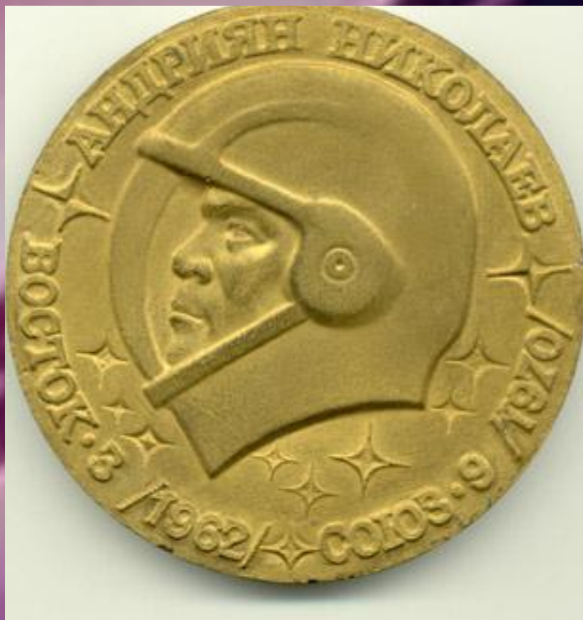
Модель монеты "Андрян Николаев. "Восток-3" (1962), "Союз-9" (1970)". 1990 г.