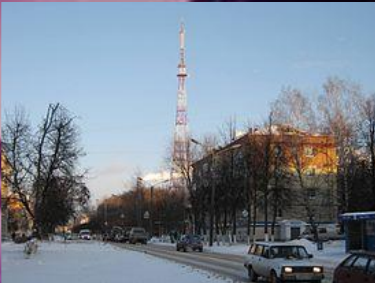
Улица космонавта Николаева