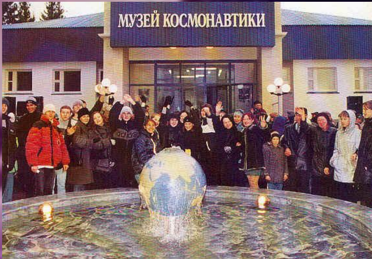
МУЗЕЙ КОСМОНАВТИКИ В ШОРШЕЛАХ