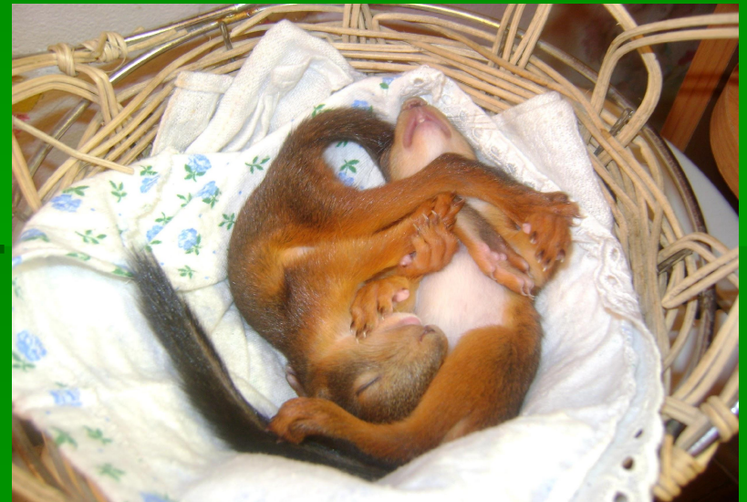
Рис. 7 спящие белочки

При рождении бельчата небольшого размера. Примерно через месяц они обрастают шерстью, а позднее открываются глаза.