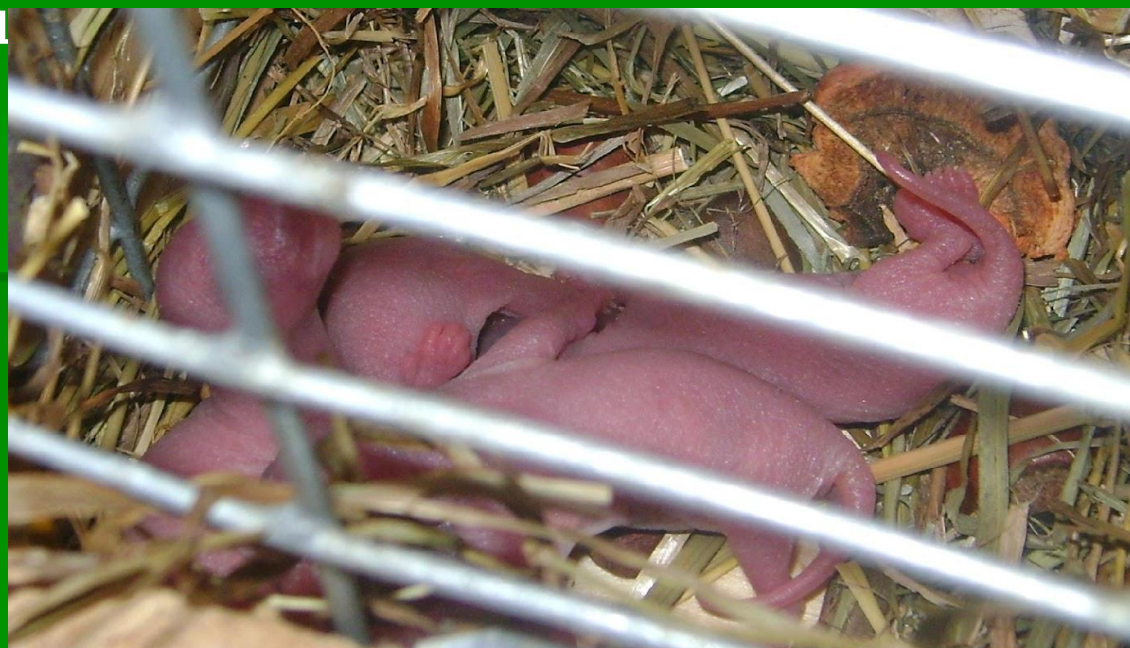
Рис. 3 Новорождённые

Как – то мы заметили, что белка ведёт себя странно. Примерно через месяц у нашей Грызуны появилось 4 бельчонка. Она за ними пристально следила и не давала самцу приближаться к малышам.