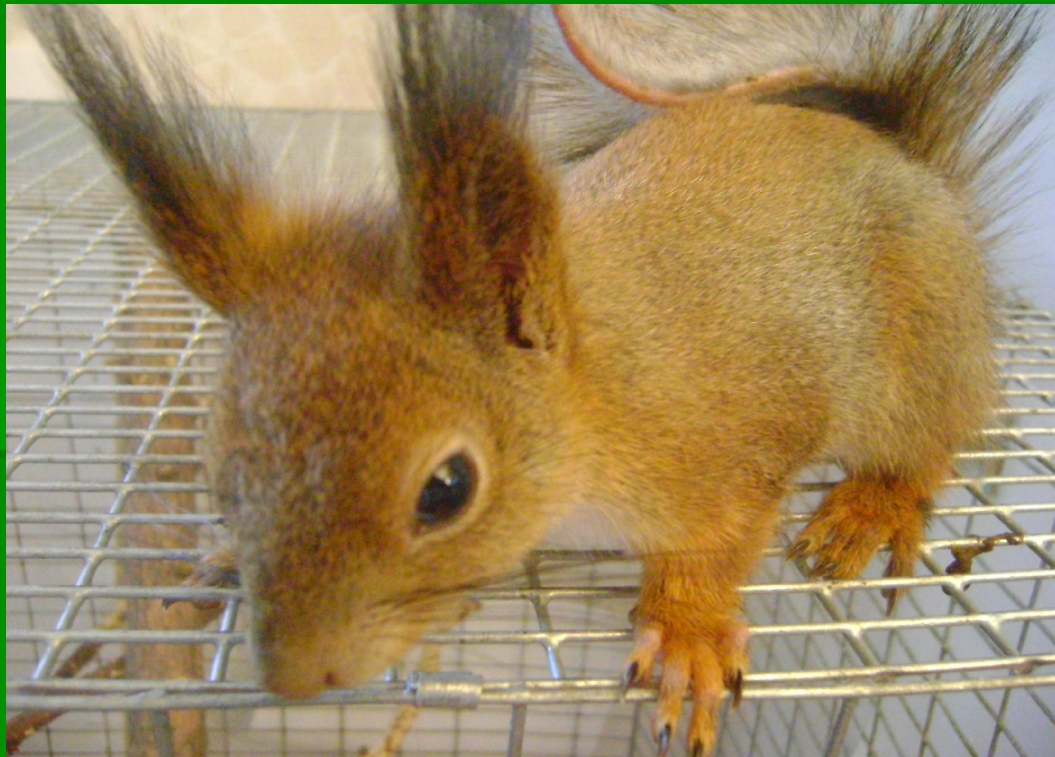
Рис. 2 Взрослая белка

Длина меховых зверьков примерно 22 см и вес у них 600г. Живёт белка около 7 – 10 лет.