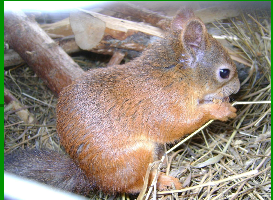
Рис. 9 Взрослый самец

На нашей планете существует множество видов белок. И некоторые виды выселяют наших рыжих белок со своей территории.