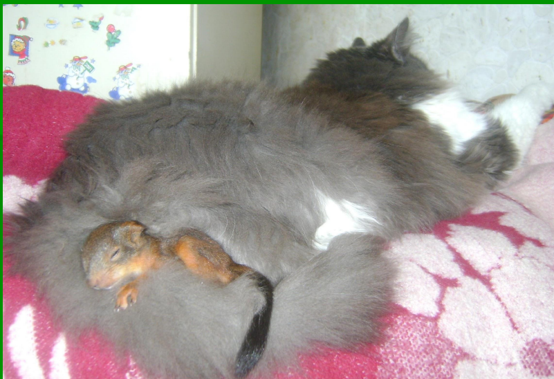
Рис. 8 Белка и кошка

В природе кошки охотятся на белок и нередко питаются ими, но только не у нас ! Маленькие бельчата не только спят в шкурке моей кошки, но и прыгают, и заигрывают.