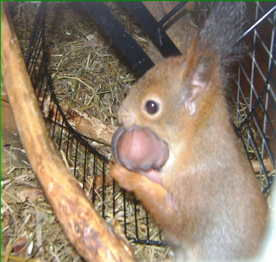
Рис. 4 Мама и её детёныш

В нашей семье доминирует самка. Она ловко отнимает орех у самца, дерётся с ним и выгоняет его из домика.