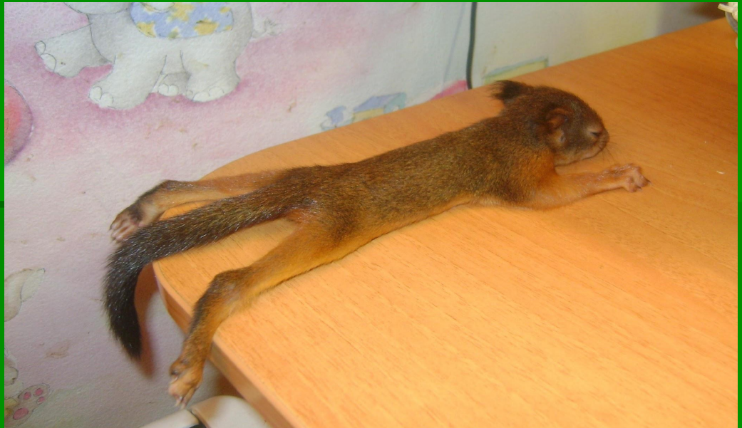
Рис. 6 бельчонок

При появлении холодов, белочки начинают утеплять свой домик. Во время холодов они укрываются хвостиком.