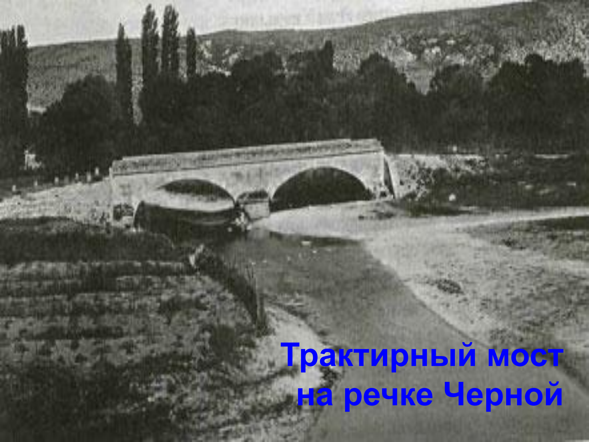
Трактирный мост на речке Черной