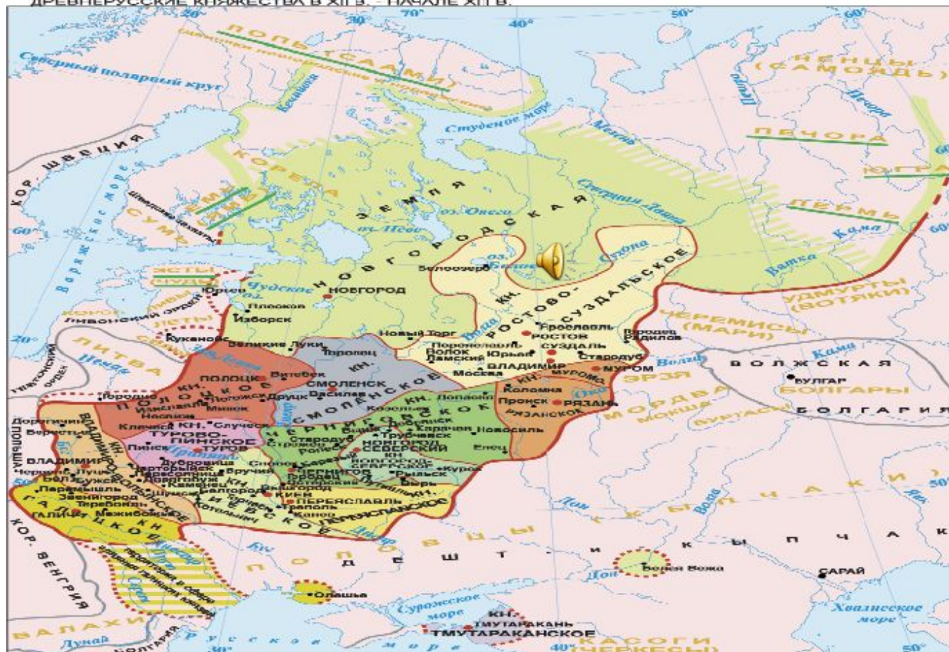
ДРЕВНЕРУССКИЕ КНЯЖЕСТВА В XII В. - НАЧАЛЕ XIII В.