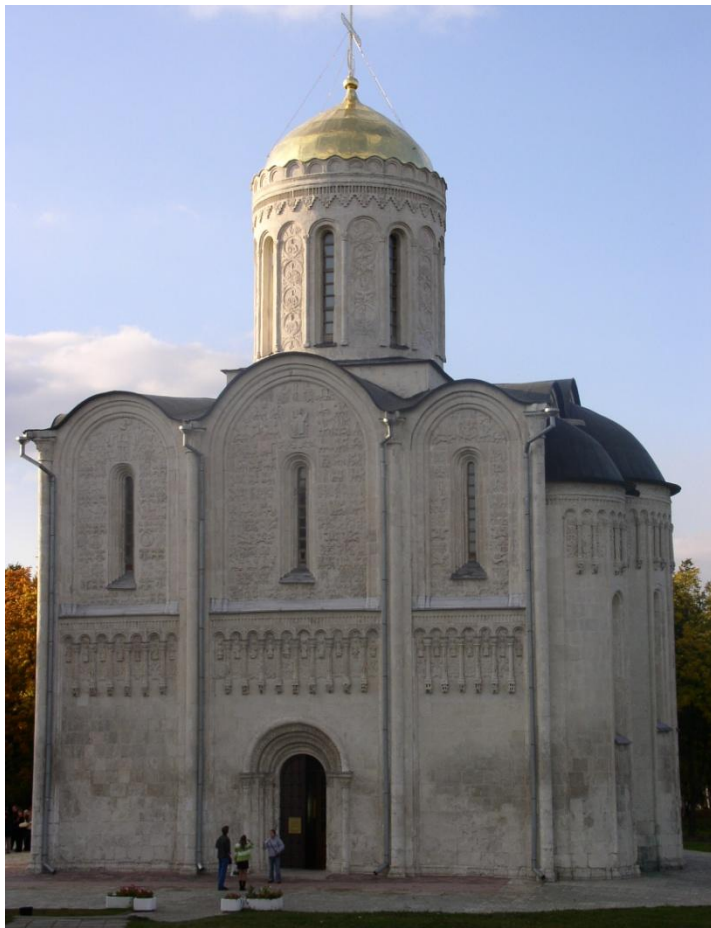
Придворный храм Всеволода

Всеволод III умер 15 апреля 1212 года во Владимире на Клязьме и был погребен в Успенском соборе. Во Владимире-Залесском и в Переяславле-Залесском Всеволод построил новые детинцы, основал Городец на р. Волге. По его приказу в Северо-Восточной Руси был создан ряд каменных церквей и среди них жемчужина русской архитектуры — Дмитриевский собор во Владимире.