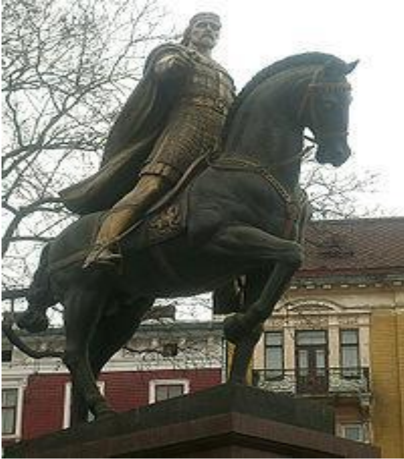
Памятник Даниилу Романовичу