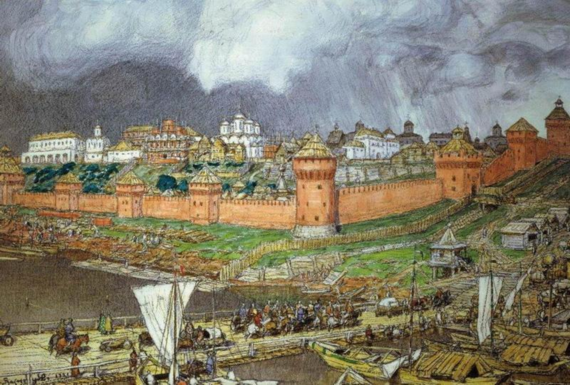
Васнецов Аполлинарий Михайлович (1856-1933): Московский Кремль при Иване III