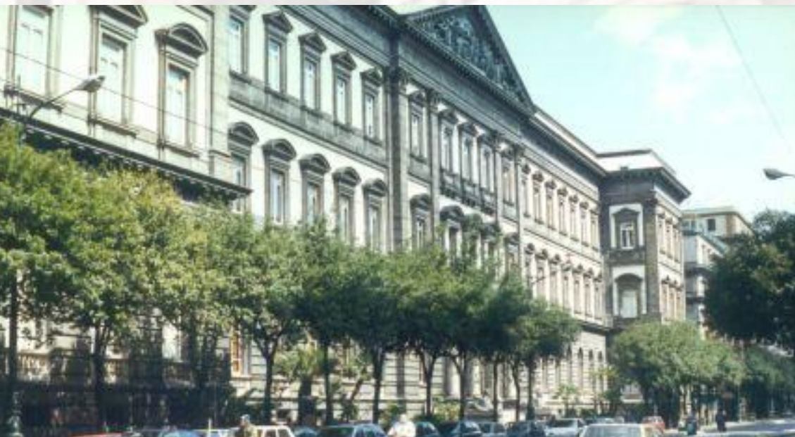
Неаполитанский университет имени Фридриха II