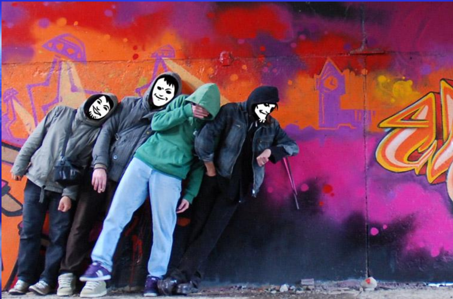
Фрагмент спектакля по мотивам произведений Бредбери.