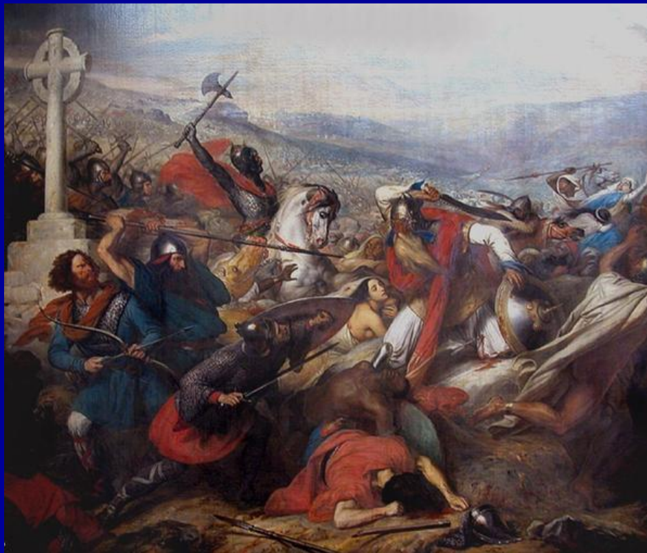
Битва у Пуатье