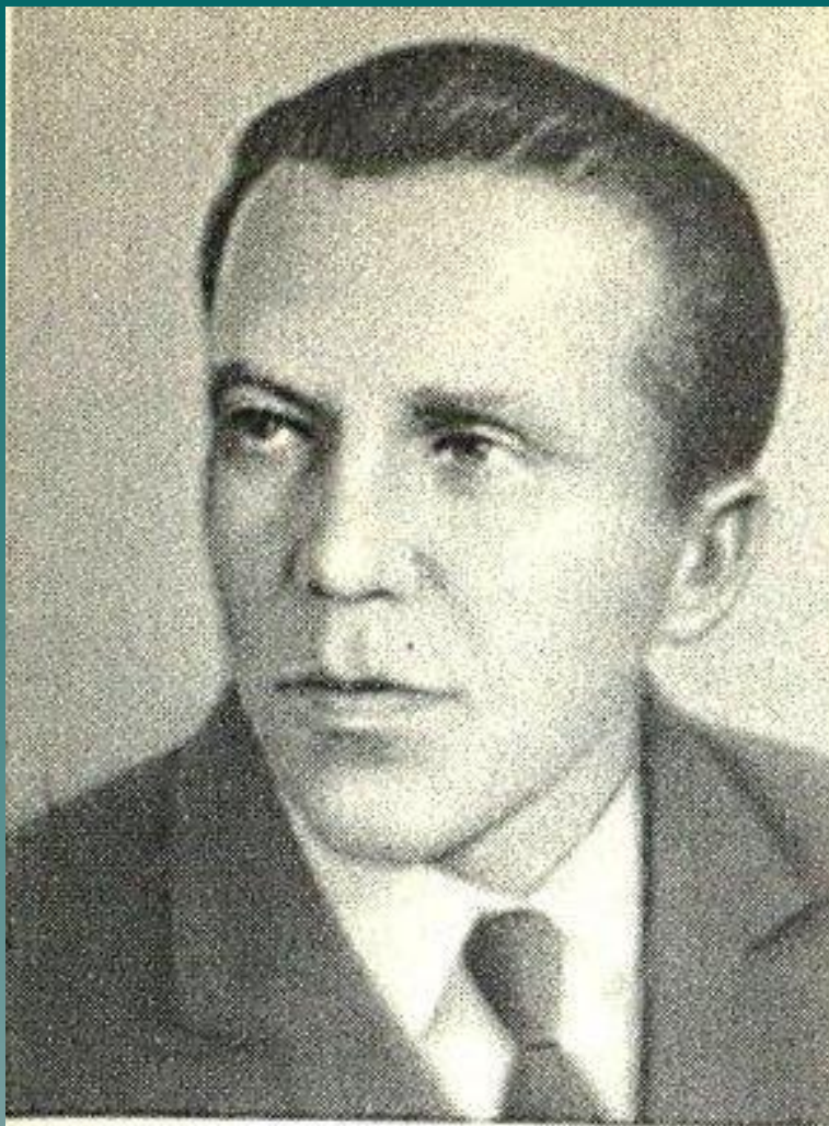
Герой Советского Союза Николай Иванович Кузнецов.

"Я люблю жизнь и хочу жить, я ещё очень молод. Но если для Родины, которую я люблю, как свою родную мать, нужно пожертвовать жизнью, я сделаю это. Пусть я умру, но в памяти народной патриоты бессмертны".