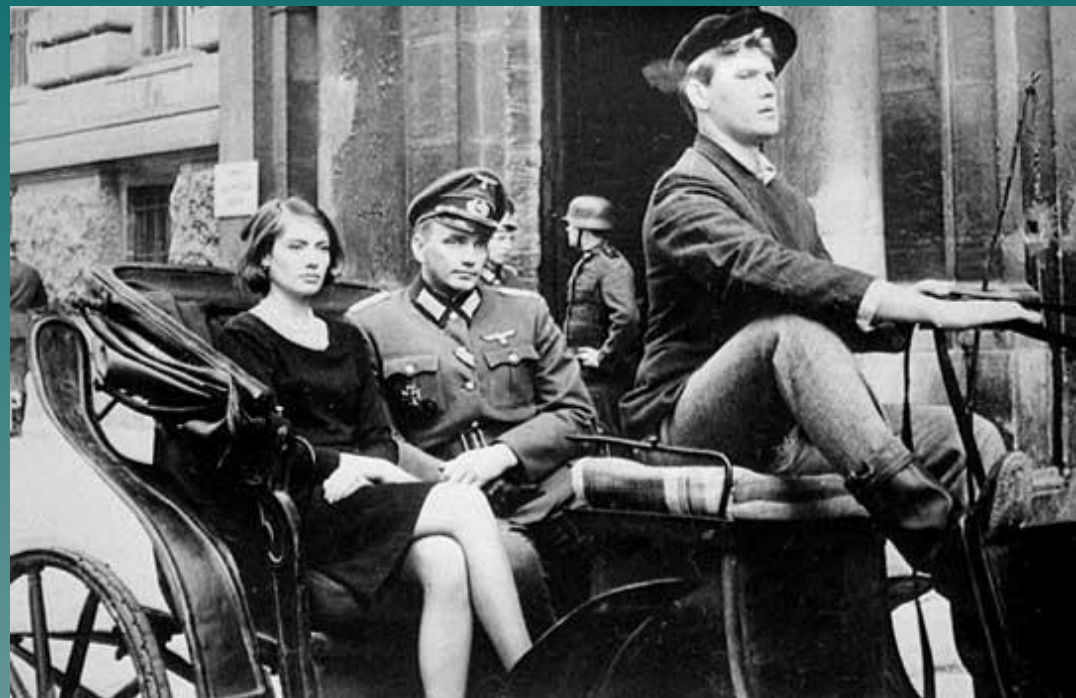
Мундир обер-лейтенанта СС Пауля Зиберта, который был использован на съемках фильма «Отряд специального назначения».