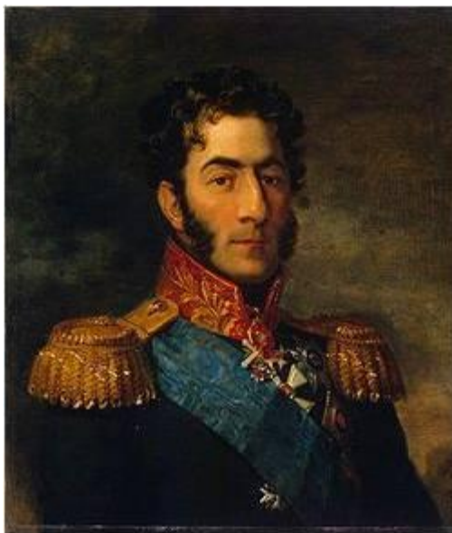
Багратион Петр Иванович