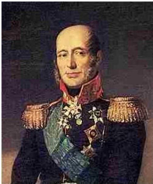
Барклай де Толли Михаил Богданович