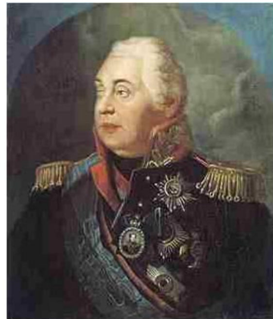
Кутузов Михаил Илларионович

8 августа 1812 г. – указ императора о назначении главнокомандующим русской армией М.И. Кутузова.