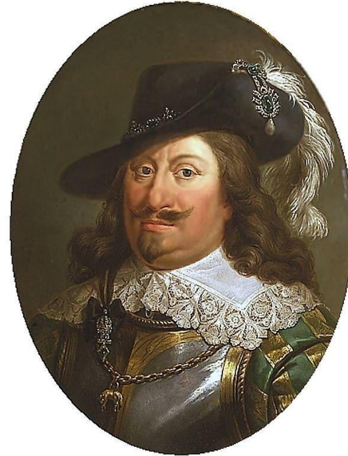
Король Польши Владислав IV Ваза