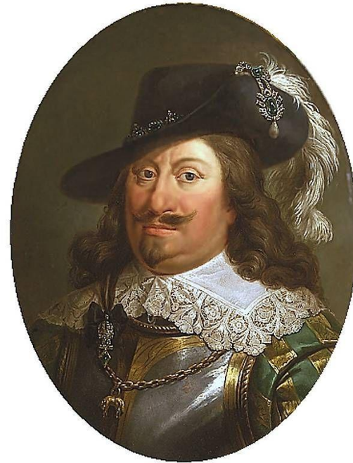
Король Польши Владислав IV Ваза