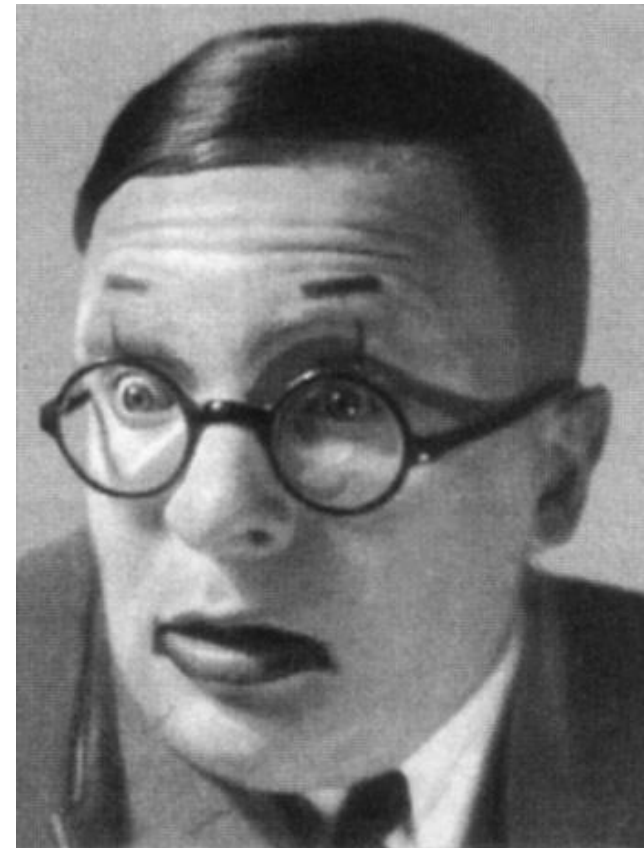
Максим Штраух в роли Победоносикова.