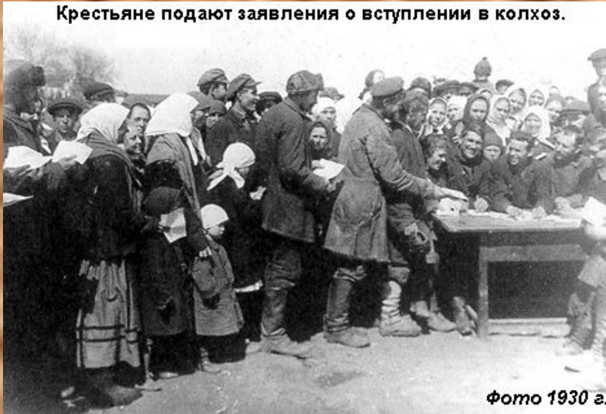
Фото 1930 г.

Крестьяне подают заявления о вступлении в колхоз.