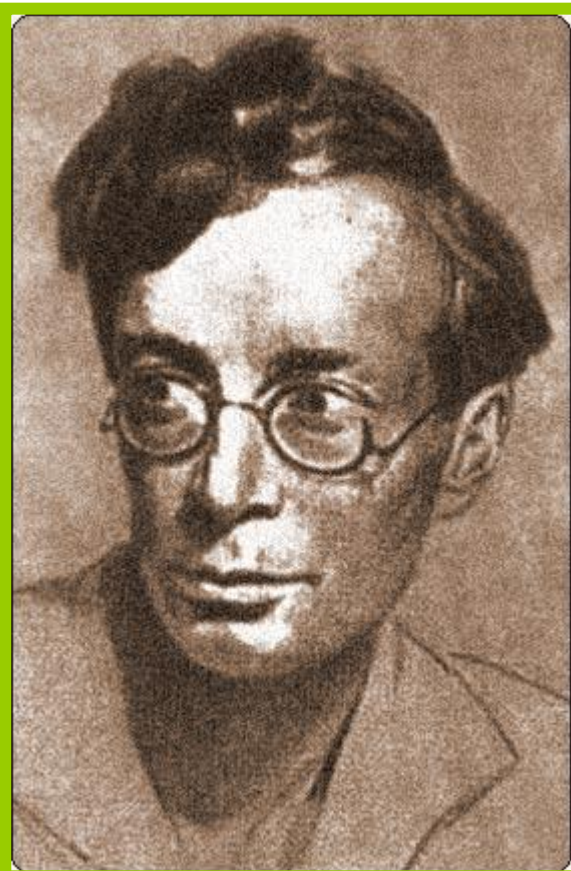
Дмитрий Борисович Кедрин (1907-1945)