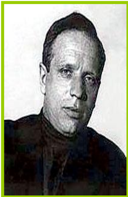
А. А. Прокофьев (1900-1971)