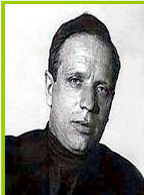
Александр Андреевич Прокофьев (1900-1971)