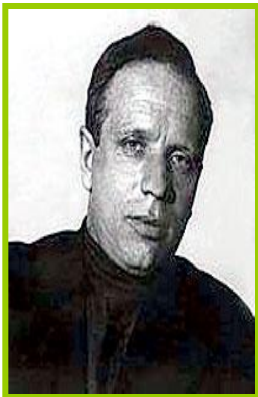
А. А. Прокофьев (1900-1971)

Осмысление картины Васнецова: очарование.