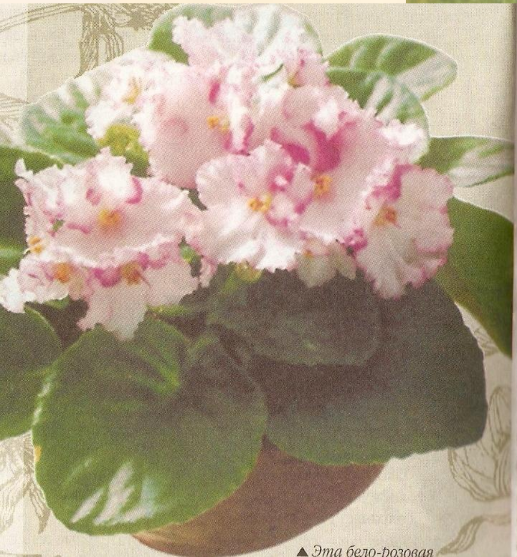
▲ Эта бело-розовая