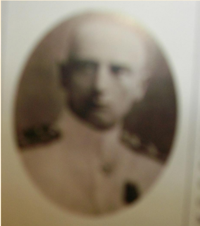
Адмирал Колчак А. И.