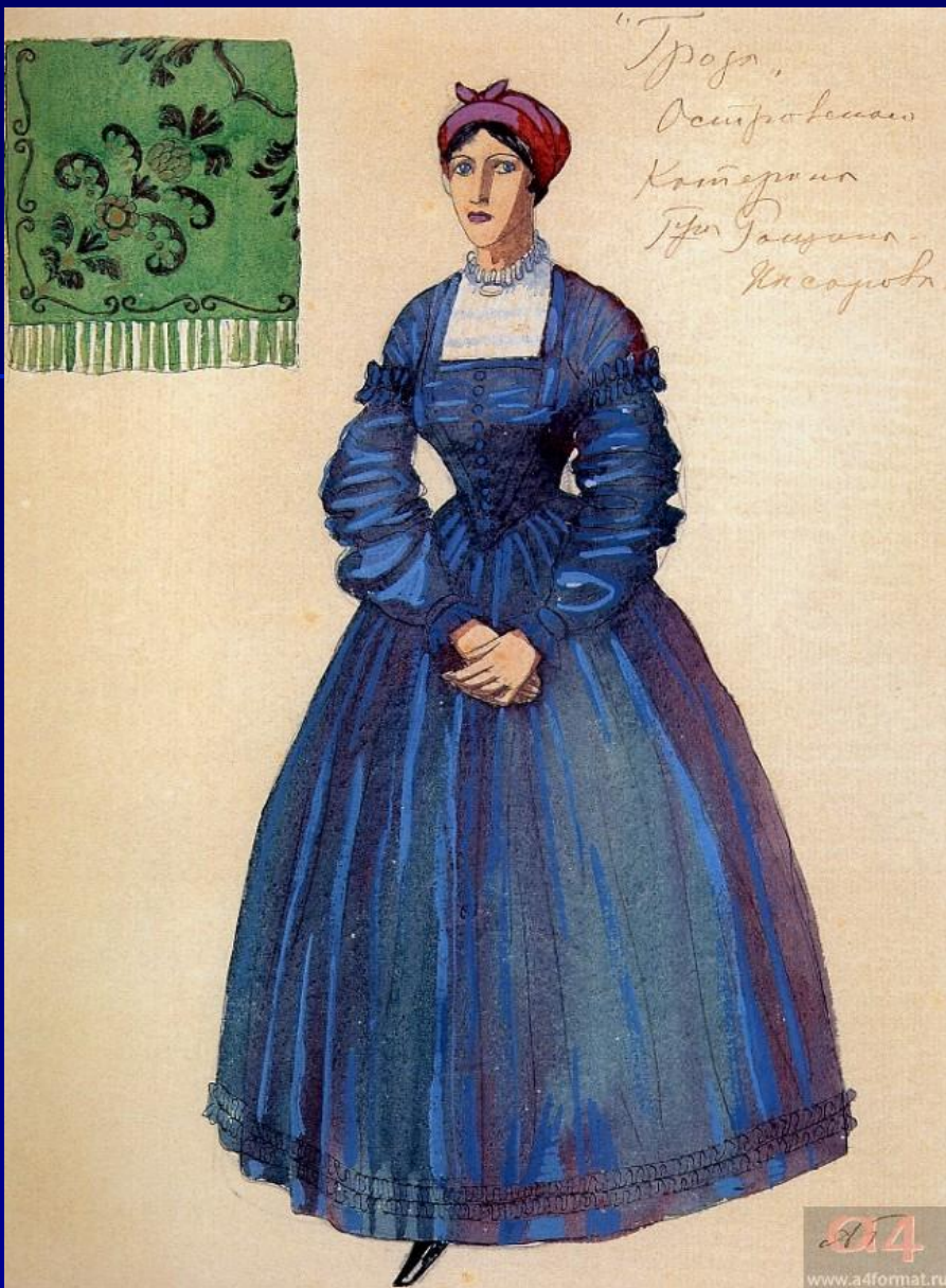
А. Головин «Катерина»

Катерина не может жить дальше со своим грехом. Она признается во всем мужу и свекрови. Но покаянию должно сопутствовать смирение, а его нет в свободолюбивой героине. Самоубийство — страшный грех, но именно на него решается Катерина, будучи не в силах существовать в мире, где люди не летают, как птицы.