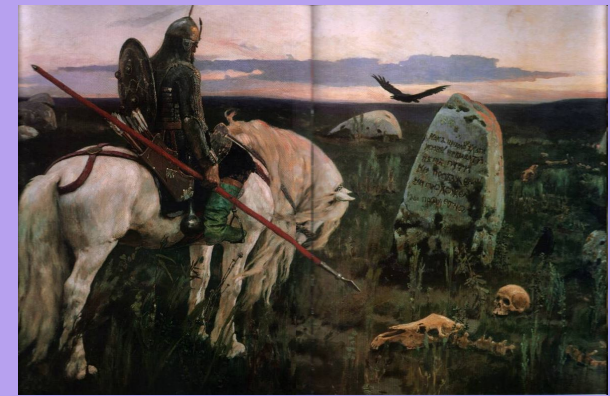
В.М. Васнецов «Витязь на распутье»