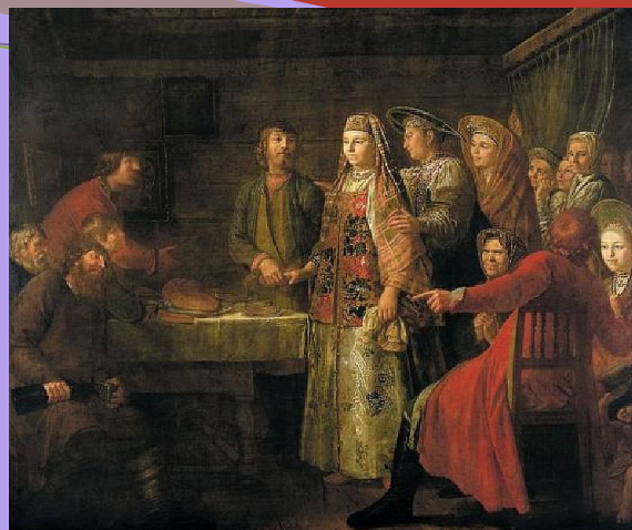
М. Шибанов «Празднество свадебного договора» (1777)