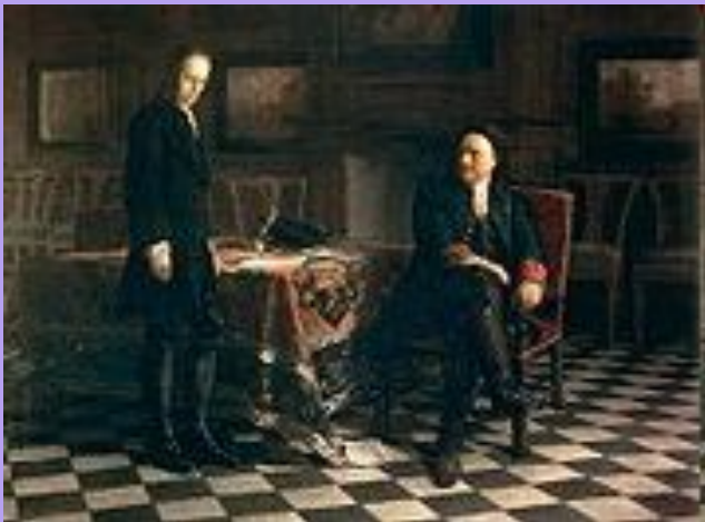
Н.Н. Ге «Петр і допрашиває Царевича Алексеє в Петергофе»(1871)