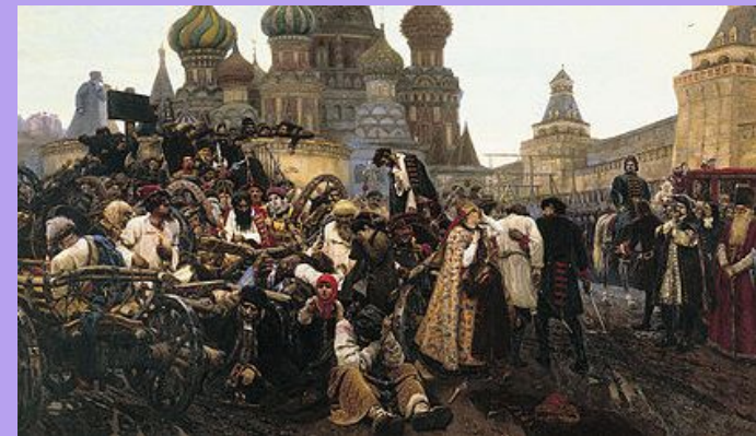
В.И.Суриков «Утро стрелецкой казни» (1881)