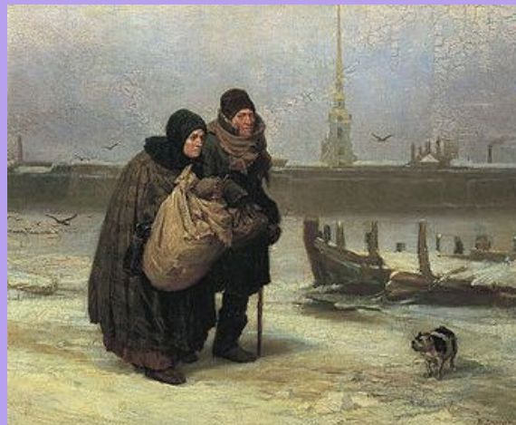
В.М. Васнецов «С квартиры на квартиру» (1876).