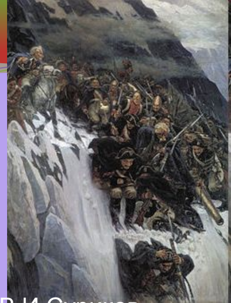
В.И.Суриков «Переход Суворова через Альпы» (1899)