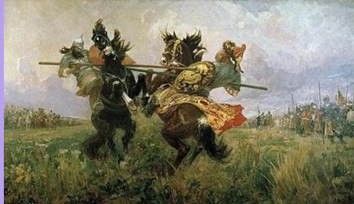
М.А. Авилов «Поединок Пересвета С Челубеем» (1943)