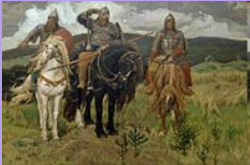
В.М. Васнецов «Богатыри» (1998)