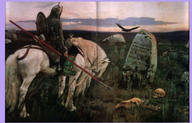
В.М. Васнецов « Витязь на распутье»