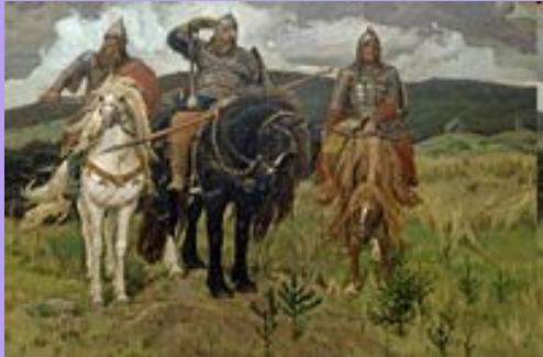
В.М. Васнецов «Богатыри» (1998)