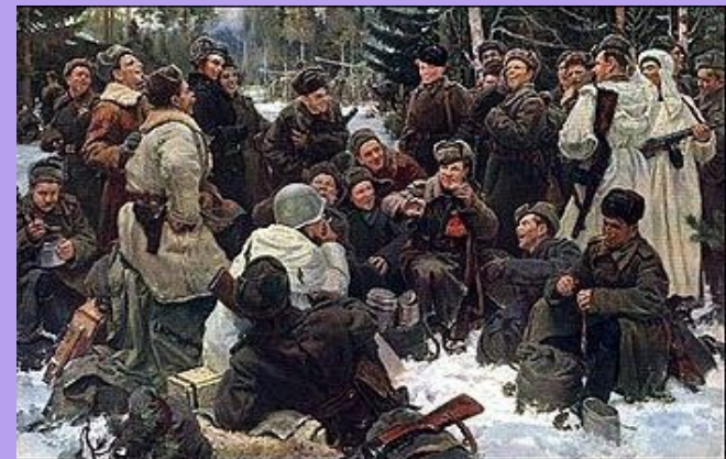
Ю.М. Непринцев «Отдых после боя»(1951)