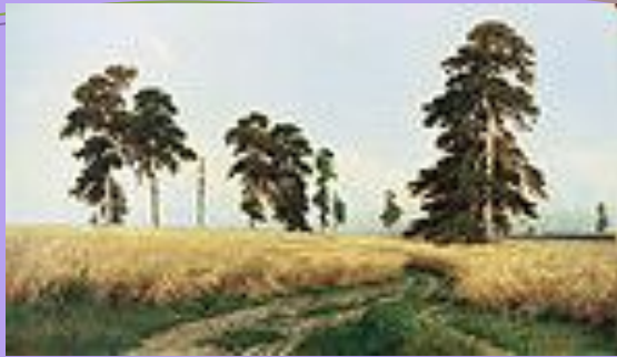
И.И. Шишкин «Рожь» (1878)