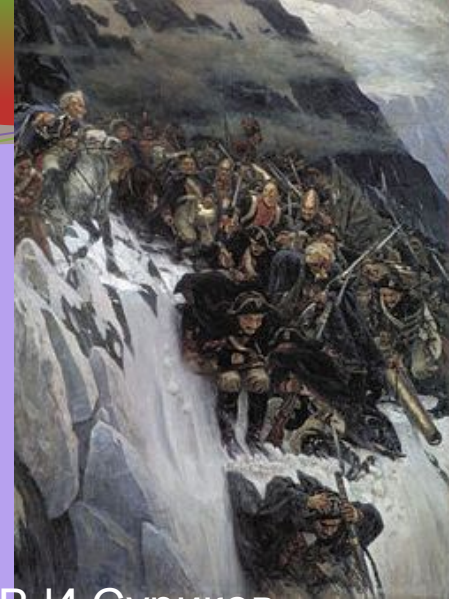
В.И.Суриков «Переход Суворова через Альпы» (1899)