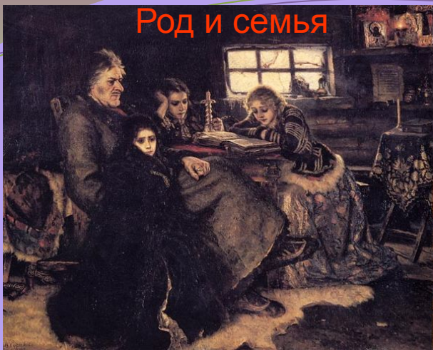
В.И. Суриков «Меншиков в Березове» (1883)