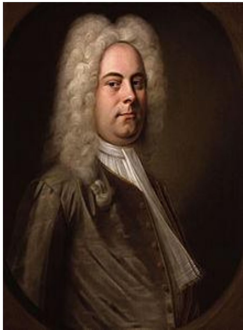
Георг Фридрих Гендель

В восемнадцатом веке Г. Ф. Гендель написал концертную ораторию, то есть ораторию, которую можно было исполнять не в храме, а в концертном зале, перед обычной публикой. Благодаря этому композитору оратория превратилась в жанр вокально-инструментальной музыки. Кроме того, сюжет произведения мог охватывать не только библейские притчи, но и