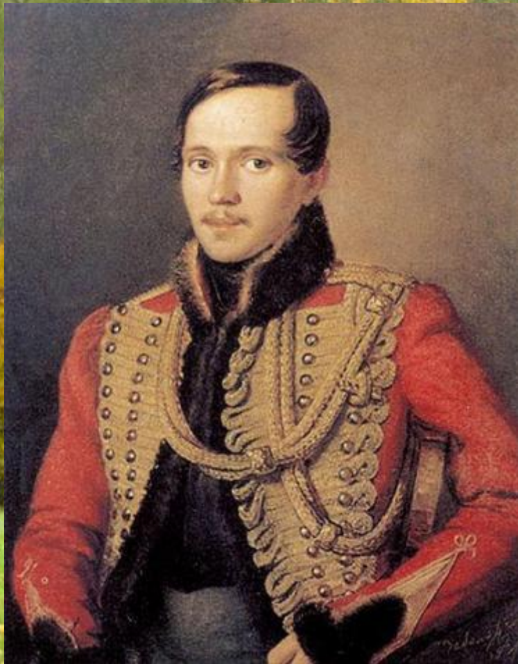
П. Е. Заболотский. Портрет М. Ю. Лермонтова

Как Лермонтов связан с образом Демона? Почему появляется в творчестве поэта этот образ?