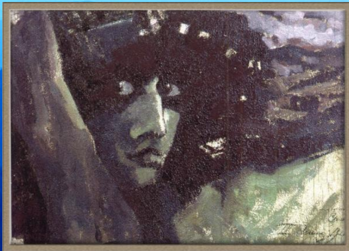
М. Врубель. Голова Демона на фоне гор.