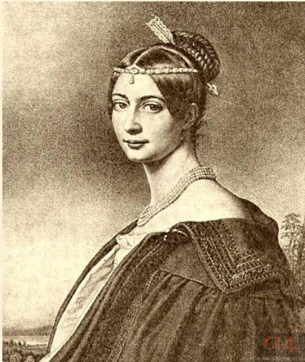
Эрнестина Дёрнберг. Литография Г. Бодмера с портрета работы Й. Штилера. Мюнхен. 1833

Люблю глаза твои, мой друг, С игрой их пламенно- чудесной, Когда их приподынешь вдруг И, словно молнией небесной, Окинешь бегло целый круг... Но есть сильнее очарованья: Глаза потупленные ниц, В минуты страстного лобзанья, И сквозь опущенных ресниц Угрюмый, тусклый огонь желанья.