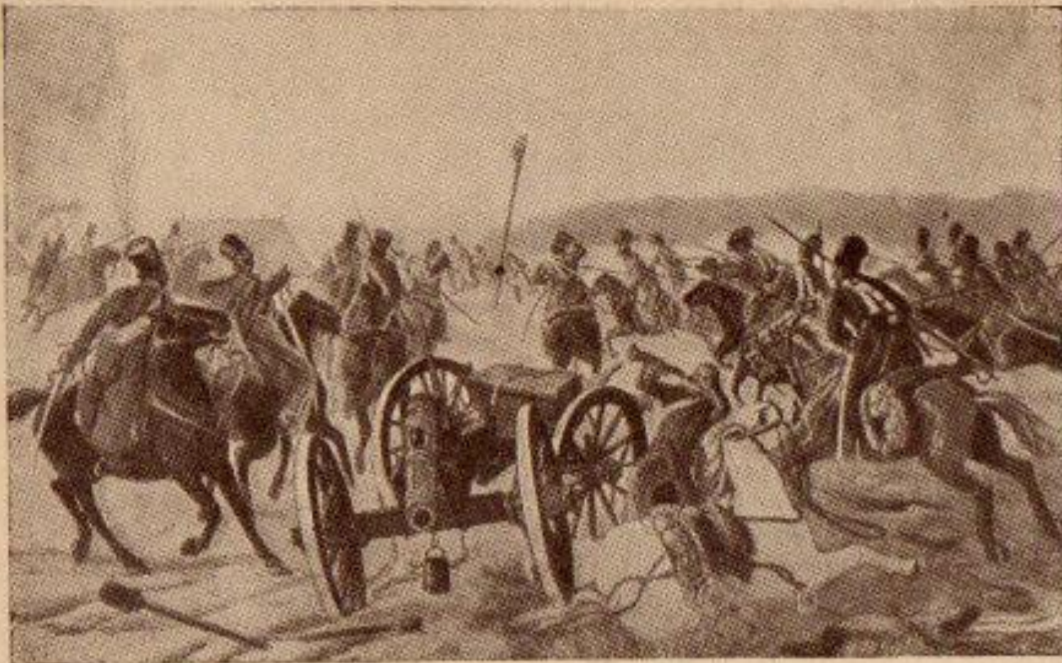
Атана донскихъ казаковъ при мѣстечкѣ Мирѣ 27 іюня 1812 г.

Атаманъ ген. Платовъ наказалъ польскую кавалерію, 27 іюня при мѣст. Мирѣ и 14 іюля при мѣст. Романовѣ, деревню сразиться. Судьба сохранила намъ врожденное превосходство надъ поляками; казакамъ первымъ представилась честь возобновить въ сердцахъ ихъ сіе чувство.