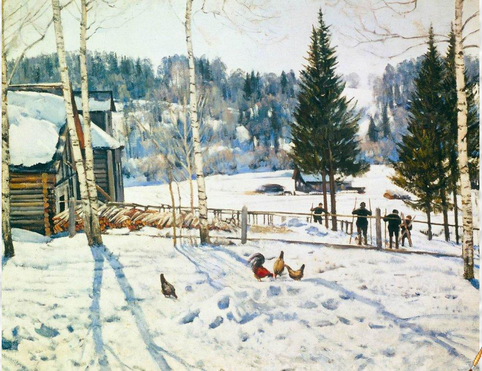
«Конец зимы. Полдень. Лигачево»