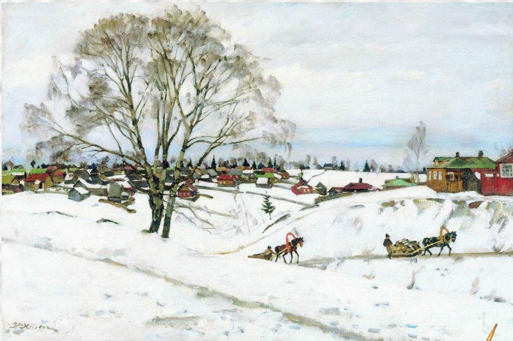
«Зима. Черные березы. Сергиев Посад»